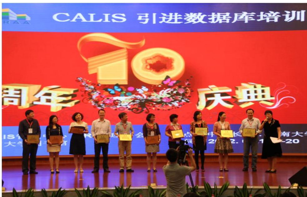
十所高校获得CALIS及DRAA联合颁发的“高校引进资源集团采购组织贡献奖”

除组织国内高校图书馆进行引进资源集团采购之外,北京大学图书馆积极拓展合作领域,进一步提高集团采购的影响力。近年来,北京大学图书馆与香港高校图书馆咨询委员会联合组织了英文图书跨区域联盟采购,将联盟采购区域扩大到香港、澳门及新加坡。跨区域英文图书合作馆藏发展计划的成功实施,是内地高校图书馆与香港、澳门、新加坡等地区高校图书馆在文献资源建设方面的首次成功合作,开创了内地与其他地区高校图书馆联合建设馆藏的先河。 □