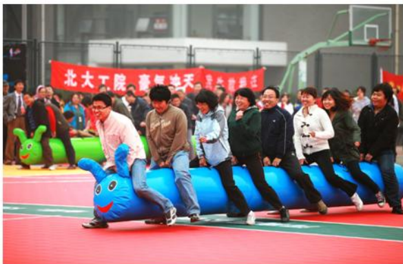
“毛毛虫”趣味项目为大家带来欢乐