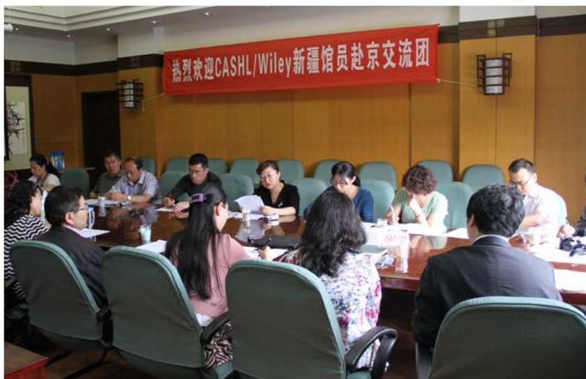
CASHL管理中心欢迎新疆代表团一行

CASHL学科中心馆——中国人民大学图书馆、清华大学图书馆和北京师范大学图书馆。交流团所到之处，都受到了热烈的欢