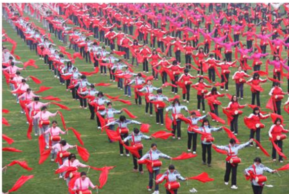
在全校团体表演中的图书馆腰鼓队

在寓欢笑于运动的比赛中，获得团体总分好成绩与所有参赛运动员顽强拼搏的精神是分不开的，这项荣誉必将激励图书馆员工在今后的各项工作中继续团结奋进，向建设世界一流大学图书馆迈进。