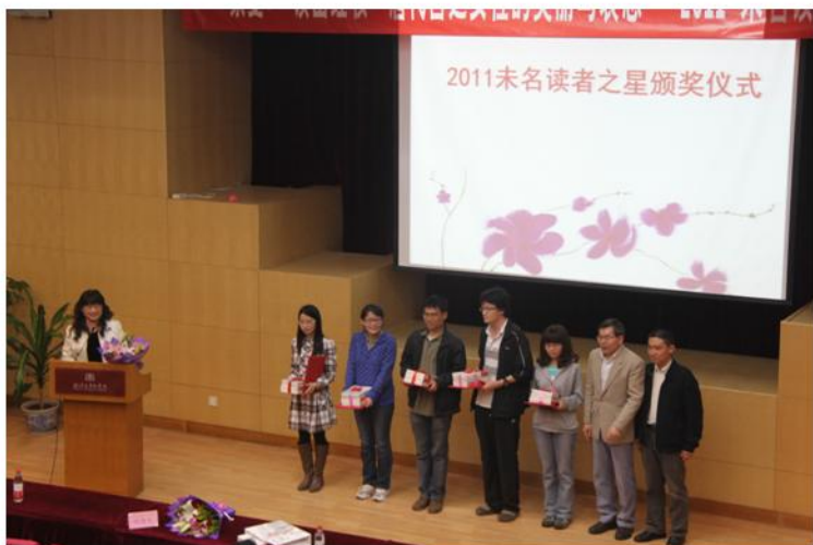
未名读者之星颁奖仪式

为迎接“世界读书日”，4月23日，图书馆联合北京大学耕读社在北配殿报告厅举办“4.23世界读书日主题讲座暨未名读者之星颁奖仪式”。