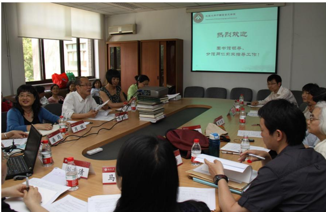
中文系分馆评估会现场

切，不仅能经常性地组织老师荐购文献，还为读者提供学术会议、发稿、约稿等学科化咨询服务以及借阅信息提醒服务等，各项工作都受到了教员的肯定。评估组在肯定成绩的同时，建议中文系进一步拓展经费渠道，加强汉语语言学以外专