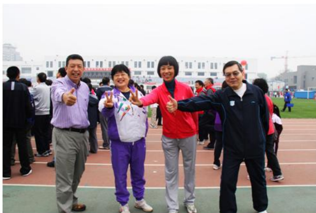
图书馆馆长参加接力赛

图书馆一直以来都非常重视体育健身活动，希望全体员工通过体育锻炼能有一个健康的身体。图书馆的领导在大型体育活动中亲历亲为，尽可能为员工活动创造条件，为全馆运动健身营造了良好和谐的氛围。本次校运动会，图书馆员工克服了主力运动员伤病多、练习时间短等不利因素，团结一心、积极进取，赢得了属于集体的荣誉。同时，图书馆工会精心准备，将运动会的工作做得稳妥而完善，保证运动员专心比赛而没有后顾之忧。