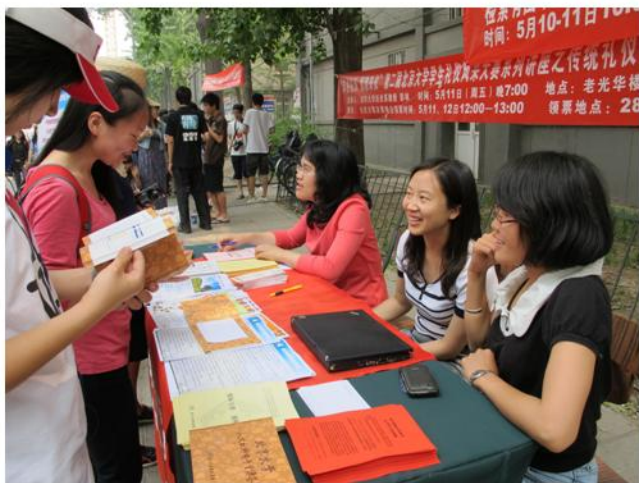
学科馆员解答同学们的问题