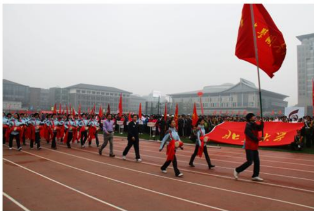
图书馆代表队经过主席台