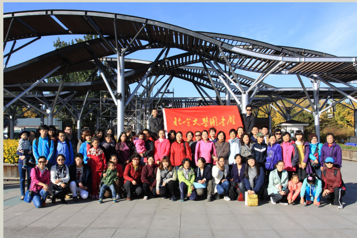
图书馆组织职工奥林匹克公园秋游

主 编：别立谦 责任编辑：刘彦丽 编辑制作：雨 虹 发 行：张 健 打 印：北京大学数字加工中心