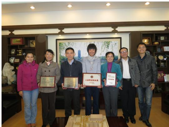
图书馆工会委员合影