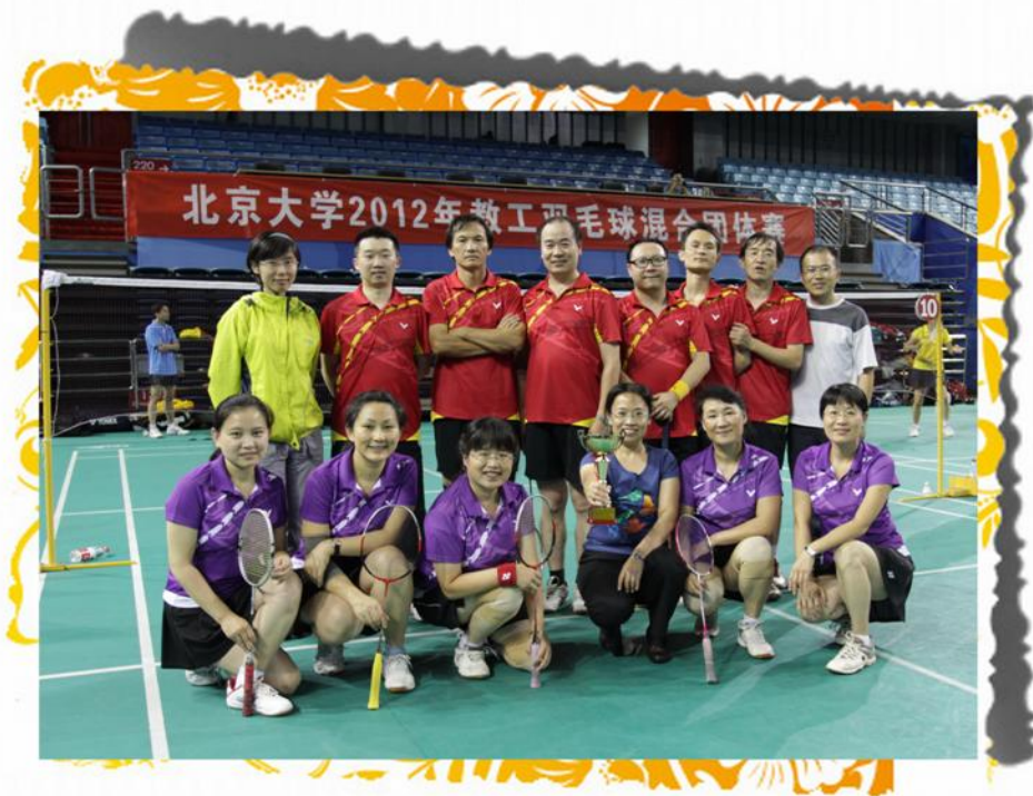
北京大学图书馆羽毛球队合影留念

决赛中，图书馆一队派出最强阵容，首战男双气势如虹，以出色的发挥遏制了对手，轻松拿