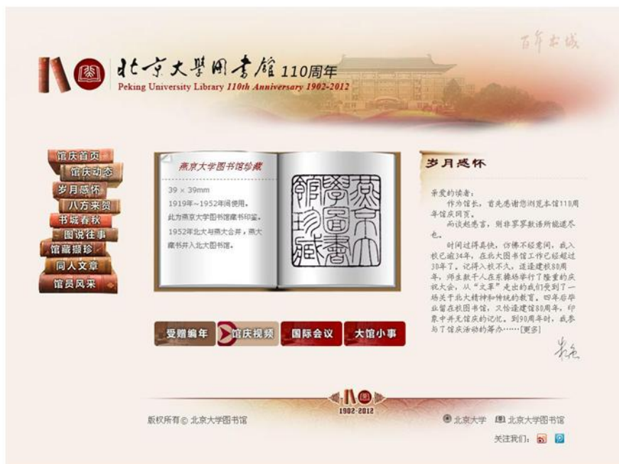
北京大学图书馆110周年馆庆主页

馆庆主页经过多部门合力精心设计、广泛探讨，开辟了馆庆动态、岁月感怀、书城春秋、图说往事、同人文章、馆员风采等多个栏目。其中，“岁月感怀”栏目从不同侧面记载了一代又一代北大图书馆人在为读者默默奉献中所发生的平凡故事；“书城春秋”栏目以编年体的形式记录了北大图书馆1902至2012百余年间发生的大事记；“图说往事”栏目分为“建国前”、“改革开放前”、“改革开放后”三个历史阶段，以照片加注释的方式，直观地勾勒出图书馆发展