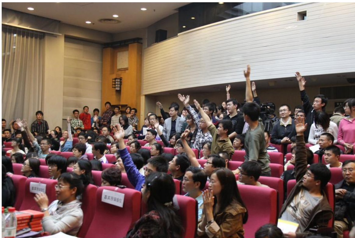
讲座现场学生们踊跃提问

演讲结束后进行问答环节。有同学让他评价中日国民素质，他强调：中国地域辽阔，人口众多，人们之间的异质性很强，素质差异很大，有素质极高者，也不乏低素质者。甚至，中国人彼此之间的差异会大于中国人与外国人之间的差异。外国人往往倾向于通过个别中国人的言行来评价中国国民素质，这是片面的。萨苏以他本人在日本和美国的生活经历证明，在美国和日本的中国人素质都非常高。关于钓鱼岛，反日还是亲日？萨苏说抵制日货的效果并不明显，最有效的方式也许是停止向日