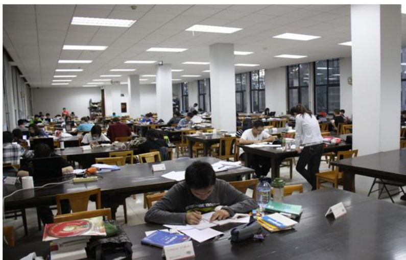
图书馆阅览室延长开馆时间