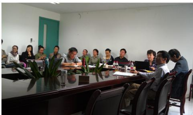
学科馆员向艺术学院老师介绍图书馆的资源与服务