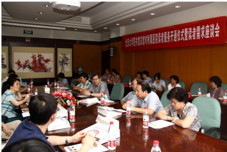
北京大学图书馆总馆对附属医院读者服务开通仪式暨读者需求座谈会

临床医院工作人员成为北大图书馆的用户表示欢迎。他介绍,北大图书馆拥有的文献资源是国内最多的,而资源是服务一切的基础。图书馆一直在开辟新的服务领域,近年开展的学科服务、举办的各种形式