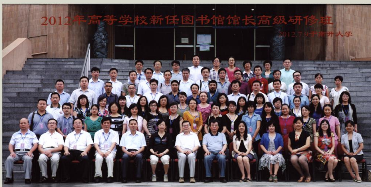
2012年高等学校新任图书馆馆长高级研修班合影

主 编：别立谦 责任编辑：张 健 编辑制作：雨 虹 发 行：刘彦丽 打印制作：北京大学数字加工中心