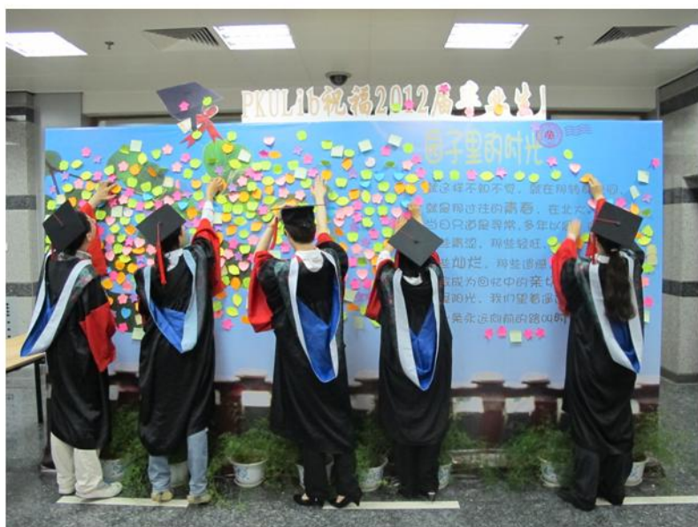
毕业生钟情图书馆“毕业墙”

道”、“图书馆，伴我度过了最精彩的岁月，感谢有你！我会努力过好每一天的”、“闲看庭前花开花落，漫望天空卷云舒，图书馆的书香气会永远镌刻在记忆里”、“真想把图书馆一起打包带走”、“图书馆应该是我在这片院子里最爱的地方了，没有之一，也许有一天我还会回来”、“谢谢图书馆常年辛劳的全体员工，给我们提供了良好的学习环境！此致，敬礼！”；还有写同学情的，如：“直到写下这些字时，毕业感才突然如潮水般涌来。四年的许多人和故事，走和未走的路。愿每人灿烂的生活”等等。