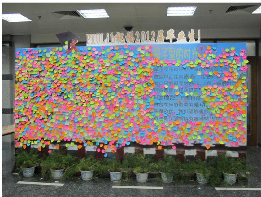
2012年毕业墙的主题：园子里的时光

今年毕业墙的主题是园子里的时光。这次活动总共收到1800多条毕业留言，有的是怀念在北大的时光的，如：“在北大的日子，一晃十一载春秋。如今毕业在即，仿佛不觉得会远离这个园子。实在是有很深的北大情结”；有的是抒发燕园情的，如：“一生中