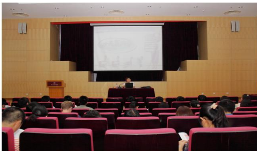
图书馆老师在给新生介绍图书馆相关情况

9月7日下午，最后一批新生入馆教育完成，至此，为期4天的2012年度图书馆迎新工作圆满结束。