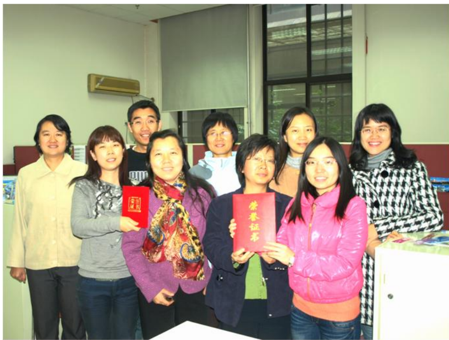
信息咨询部的学科馆员