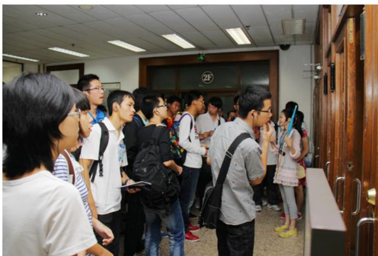
图书馆带队老师使用无线同传设备带新生在馆内参观